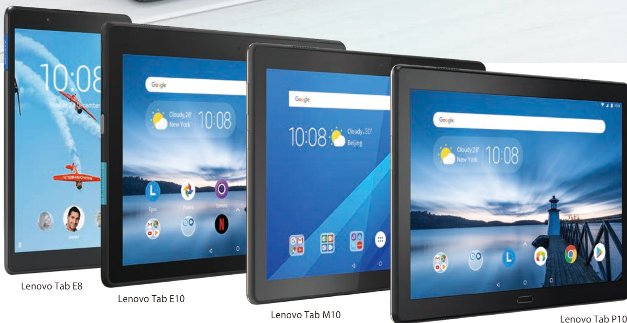
Lenovo Tab E8