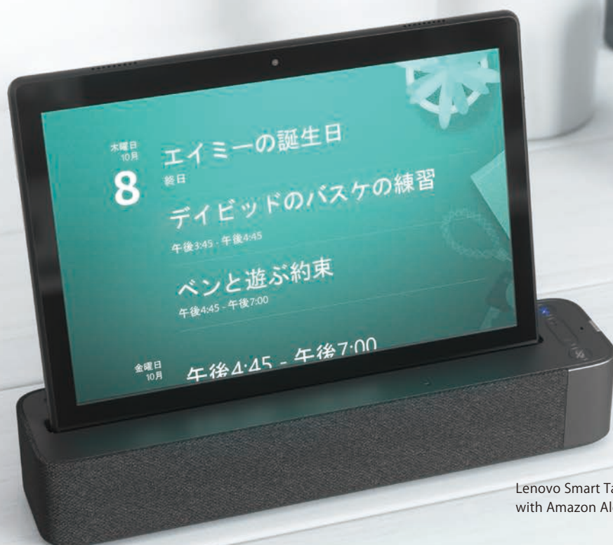
Lenovo Smart Tab M10 with Amazon Alexa