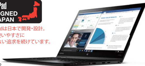
ラップトップモード

ThinkPadは日本で開発・設計。 品質と使いやすさに 妥協のない追求を続けています。