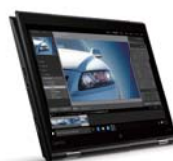
タブレットモード