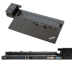
デュアルコア搭載モデルのみ対応

※DisplayPortとDVI-Dを同時にご利用頂けません。同時に接続をした場合は、DisplayPortが優先されます。