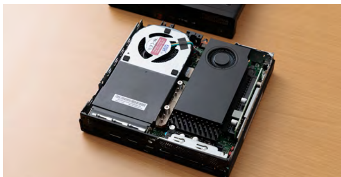
緻密に計算されつくした内部設計ゆえに排熱性能が非常に優れている

熱と音という、作業環境に影響する要素がしっかりとコントロールされている点も、実務において見逃せないポイントだ。