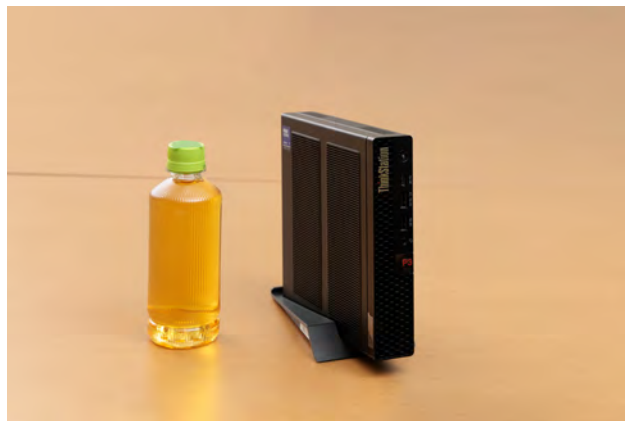
350mlペットボトルよりも少し高いくらいのサイズ感

このようにP3 Tinyは、従来のモバイルワークステーションでも据え置きデスクトップでもない、『持ち運べるデスクトップ』という新たな可能性をもたらす1台になるだろう。