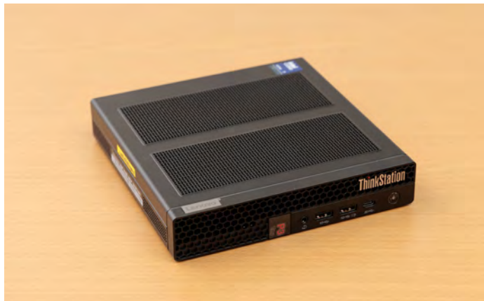
検証に使用したThinkStation P3 Tiny Gen 2

本当にP3 Tinyは、設計業務に耐えられる性能を持ち合わせていないのだろうか。そこで、CADistの全面協力のもと、実務に即したデータを用いた性能検証を実施し、その真の実力を解き明かした。